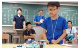
赤色のブロックを上手く避けながら、白色のブロックを回収します。