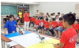
向かい合ってロボットの準備。試合開始を待ちます。