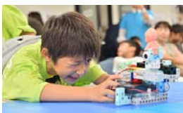
よ〜くブロックタワーを狙って...

コース上に設置された白色のブロックを回収する自走式ロボットで、得点を競います。赤色のブロックを回収してしまったり、デッドゾーンを通過するとマイナス得点になるため、ロボットがゴールに辿り着くまで目が離せません