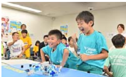
ブロックタワーが倒れると大きな歓声が上がりました。