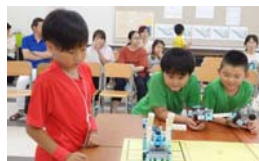
みんなが見守る中、ロボットが発表!