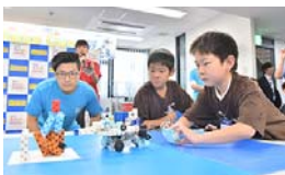
ブロックの弾(黒色)が、ブロックタワーにヒット!