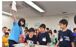
無事にゴール!審判も合格の白旗を掲げています。