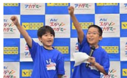
本番前のプレゼンテーション、気合が伝わってきます。