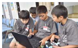
本番ギリギリまで、念入りに調整。

制限時間30秒以内に、ブロックの弾(黒色)を使って、ブロックのタワーを倒すと得点。ロボットは、据え置き型か、操作型かを選べることができます。確実に当てるために、弾を1個ずつ投げるロボットや、たくさん倒すためにまとめて弾を投げるロボットなど、工夫された様々なロボットが見られました。