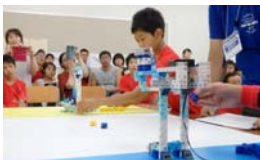
競技時間は45秒。時間との闘いにもなります。