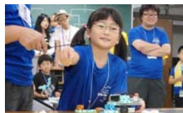
どのように進んでゴールするか発表してもらいました。

コース中央の得点エリアに、手持ちの10個のブロックを飛ばして得点を競う対戦型の競技です。得点エリアの中央にブロックを置くこと