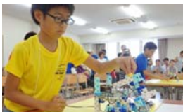
自分のエリアと同じ色のブロックをセットします。